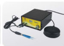
Digital Bipolar Coagulators