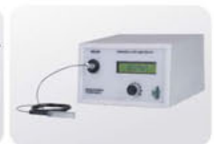
LED Cold Light Source