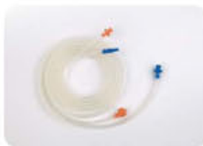
Venturi Fluidics Set