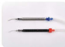
Irr/Asp Canula Handpiece